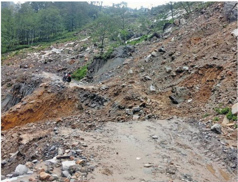
सामान्य वर्षाले भासिएको तातोपानी नाकास्थित इको पहिरो क्षेत्र सडक ।

इको पहिरो खुलाउन तुला मेसिन प्रयोग गर्नुपर्ने भएको छ । इको पहिरोबाट लेदो आइरहेको छ भने तलबाट सडक भासिँदै गएको छ । तुला मेसिन प्रयोग गरेर इको पहिरो खुलाएमा पहिरो माथिका २५० भन्दा बढी घरधुरी, गुम्बा, विद्यालय, स्वास्थ्य चौकीलगायतका भौतिक संरचना बग्ने उच्च जोखिम रहेको